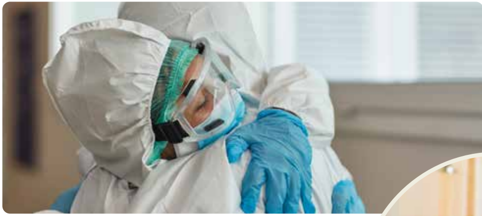
Pandemin visade på bristerna i välfärden. Vänsterpartiet vill bygga samhället starkt igen.